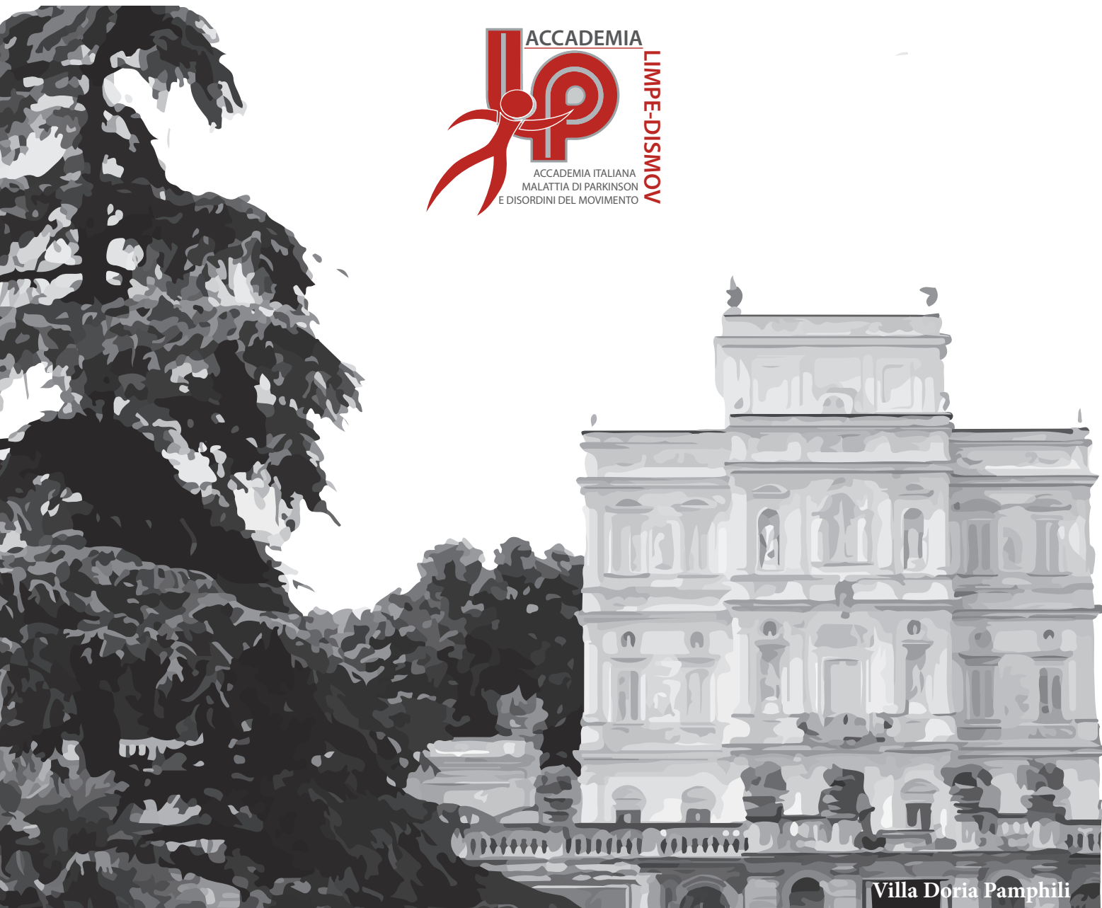
Villa Doria Pamphili